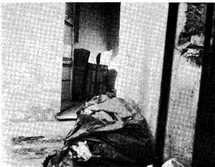
Αν αὐτὸ δεν είναι κατάντια, τότε τί είναι;

Πάντως, εἴτε οἱ ἴδιοι ἀκόμα διευθύνουν τὰ πράγματα, εἴτε καινούργιοι ἔχουν πάρει τὴ θέση τους, θὰ πρέπει νὰ ἀναθεωρήσουν τὴν ἀπόφαση και τὸ ΙΤΑΠ νὰ ξαναλειτου-