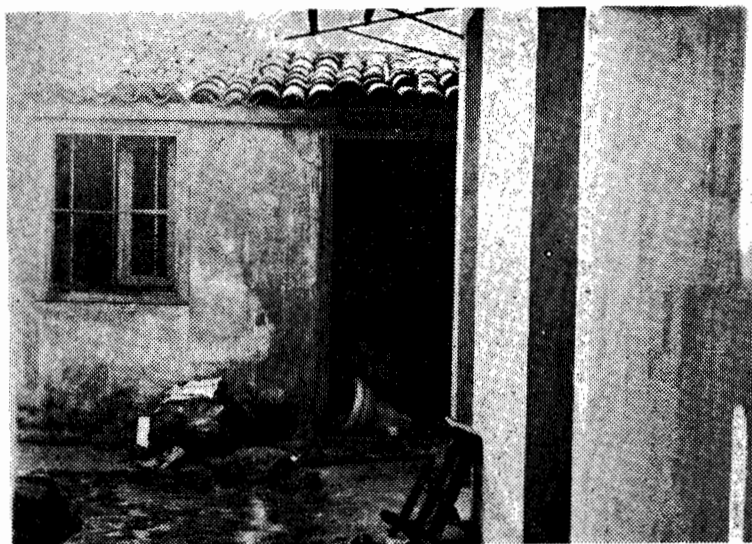
Βουλγαροκτόνου 30, Αθήνα. Ι.Τ.Α.Π. 1982.

Γραφεία : ΣΟΛΩΝΟΣ 125 — ΑΘΗΝΑ ΤΗΛΕΦ. 36 09 684