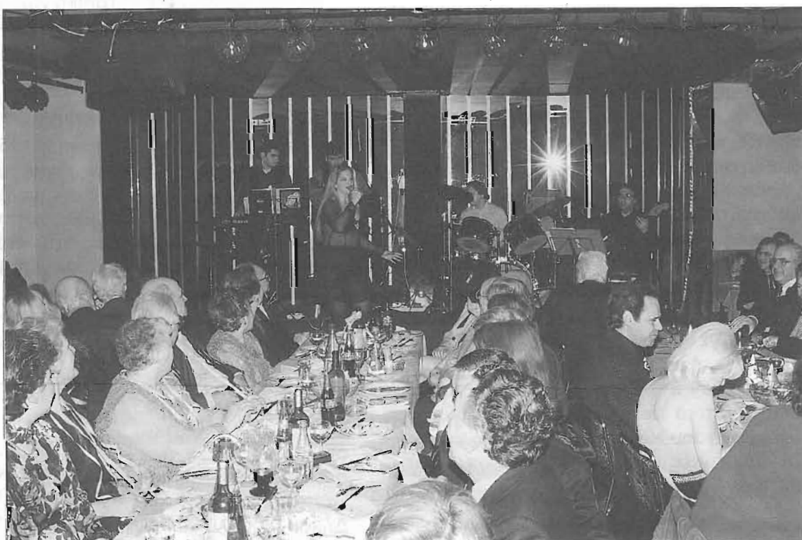
Στιγμιότυπο από τον αποκριάτικο χορό του συλλόγου μας.