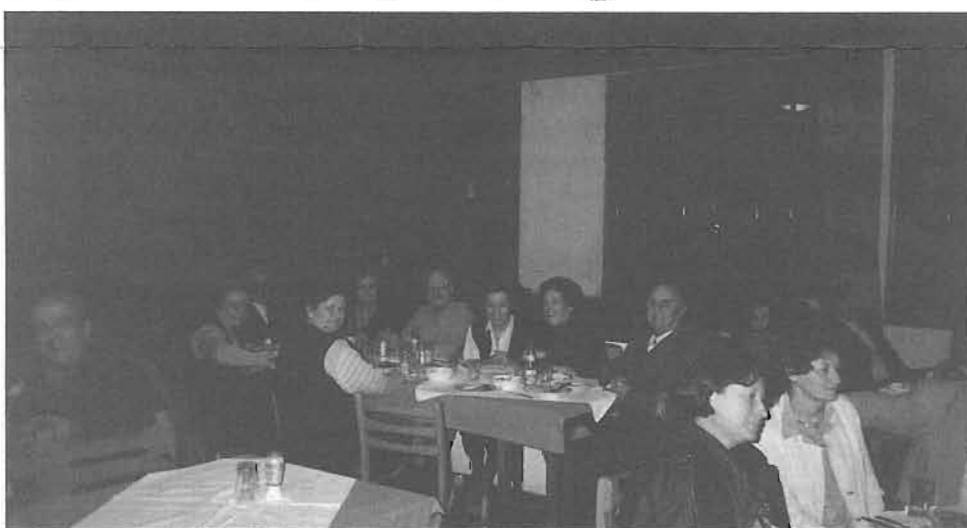
Στιγμιότυπα από την εκδρομή του συλλόγου μας.