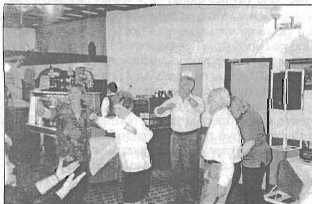
Στιγμιότυπα από το γλέντι που έγινε στην εκδρομή μας.

ρίς τ' απόγευμα φθάσαμε στο Ξενοδοχείο το "SPARTA INN", όπου έγινε και η διανυκτέρευση μας. Σύγχρονο Ξενοδοχείο, μ' όλες τις ανέσεις. Άλλοι ξεκουράστηκαν και άλλοι πήγαν βόλτα να δουν τη Σπάρτη, υπήρχε αρκετός ελεύθερος χρόνος μέχρι το βράδυ, που μαζευτήκαμε στην όλοι στην τραπεζαρία για βραδυνό και για γλέντι τρικούβερτο, που μόνο εμείς ξέρουμε. Περσμένα μεσάνυχτα σφύριξε σιωπητήριο.