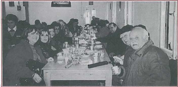
Στο Αρχονταρίκη της Μονής